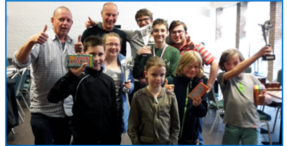
Jeugd en trainers bij de prijsuitreiking.