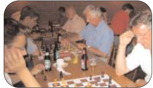
Zwoegende Messenmakers tegen WSV.

tweede met 81% (6,5 uit 8) en werd daarvoor, als topscorer die niet bij het winnende team speelde, met een extra prijs beloond. Ook het gezelligheidsteam van Messemaker ging dankzij de twee poedelprijzen niet met lege handen naar huis.