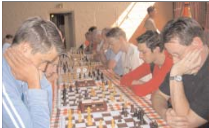
Het team van Nieuwerkerk (r.) op weg naar de winst tegen Moerkapelle.