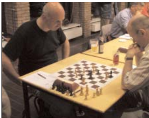
Op weg naar 3-2.