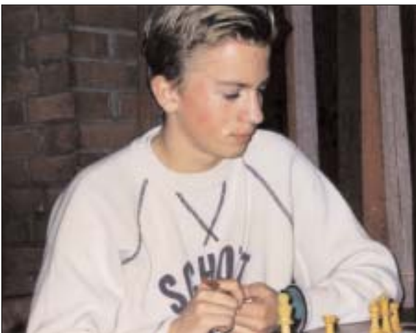
Vol punt aan bord 1 voor de nieuwe teamleider.