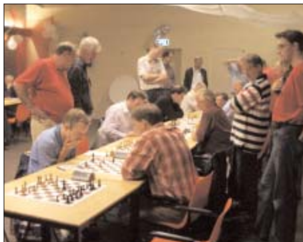
Het beslissende punt in de maak.