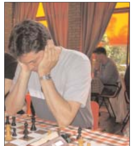
Knappe winst aan bord 2.