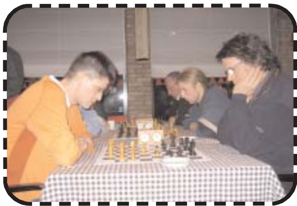
Team Eijelaar tegen de Leopolds + Stuivenberg.